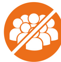
Keine Gruppen bilden